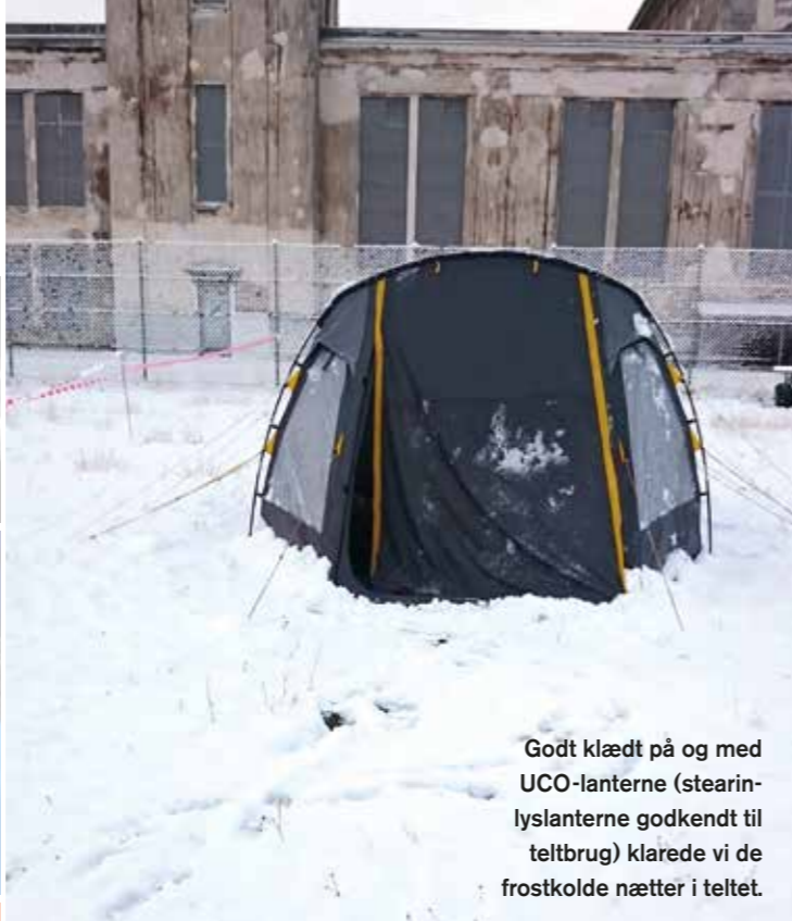
Godt klædt på og med UCO-lanterne (stearinlys-lanterne godkendt til teltbrug) klarede vi de frostkolde nætter i teltet.