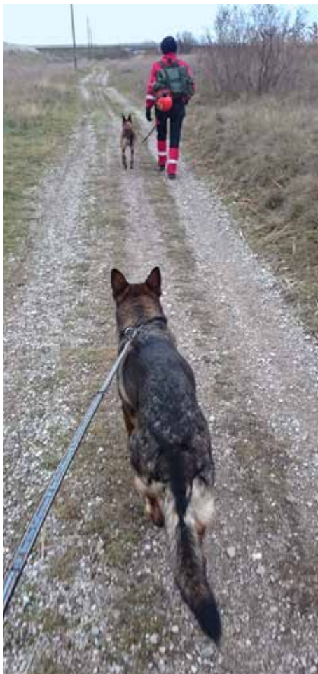
Marchen på 10 km/2 timer gik hurtigt, selvom mine fødder efterhånden var brugte af at gå i sikkerhedsstøvler, og rygsækken efterhånden følte temmelig tung.

Klokken 23 blev jeg vækket igen. Ud af soveposen, på med termokedel, dragten og rygsækken og afsted. Så var der ventetid igen. To timer, men det er netop meningen. Man skal lære at vente, for det vil man også komme til, hvis man bliver sendt ud. Første søg foregik i en bygning. Hekate fik hurtigt gennemført de to mørke kældre og stueetagen, og vi fandt en forsvundet person i begge kældre. Nattens sidste søg var i et temmelig stort ruin/naturområde, som jeg ikke måtte betræde (de færreste ruiner må man gå ind i som hundefører, før hunden har markeret en figurant), så igen var det her en test i dirigering og selvstændigt søg af hunden. To områder skulle afsøges, så der skulle lægges taktik og man skulle bruge tiden fornuftigt. Lynhurtigt blev områderne afsøgt, og en forsvundet person blev fundet begge steder. Efter debriefing var det direkte retur i soveposen. Klokken var fire om natten, og nu handlede